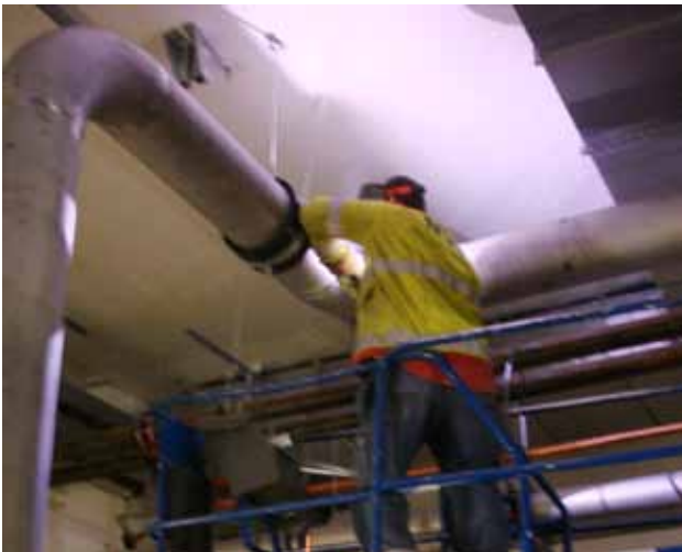
Svetsning från saxlift.