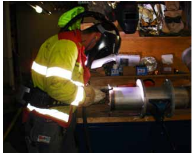
Svetsning på arbetsbänk sker i en framåtlutad position.