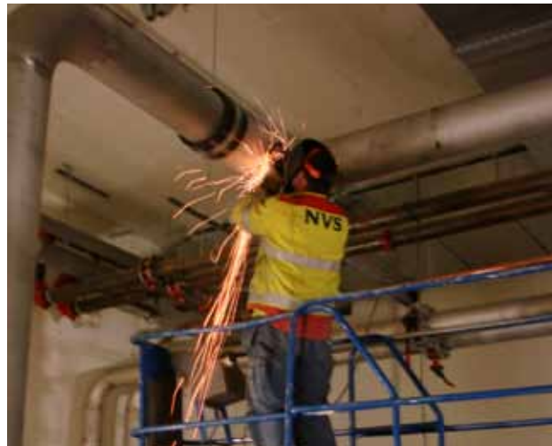
Slipning i samband med pinnsvetsning.