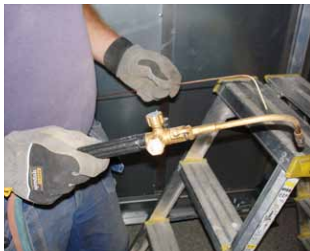
Utrustning för lödning av kopparrör.

Mer att läsa finns i rapporten "Kemiska hälsorisker vid svetsning och lödning på tillfälliga arbetsplatser. En studie av VVS-montörer", www.vvsforetagen.se samt www.byggnads.se .