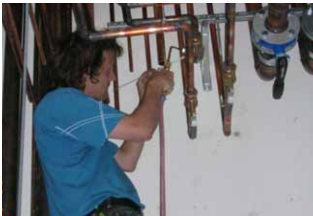
Lödning av kopparrör från hantverkarställning.