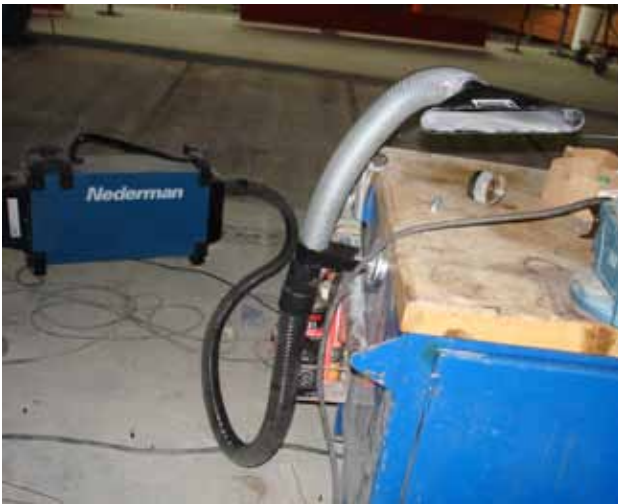
Placering av mobilt punktutsug som används vid svetsning på arbetsbänk. Man fäster magnet på bänkens sida.