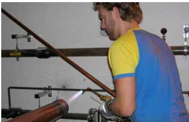
Lödning vid arbetsbänk.