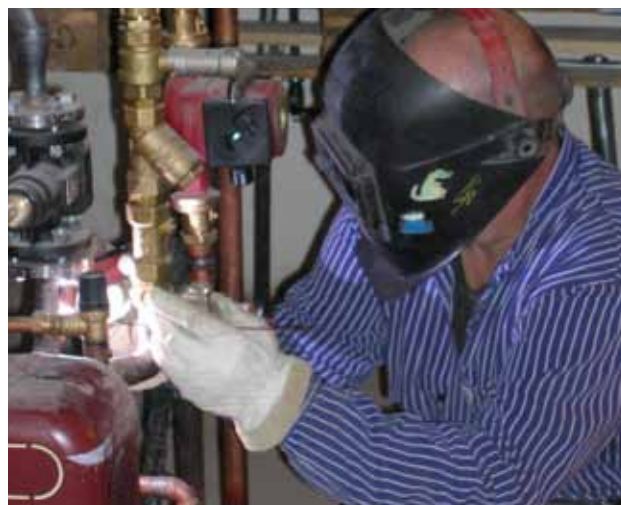
Vid TIG-svetsning bildas vanligen lite svetsrök.