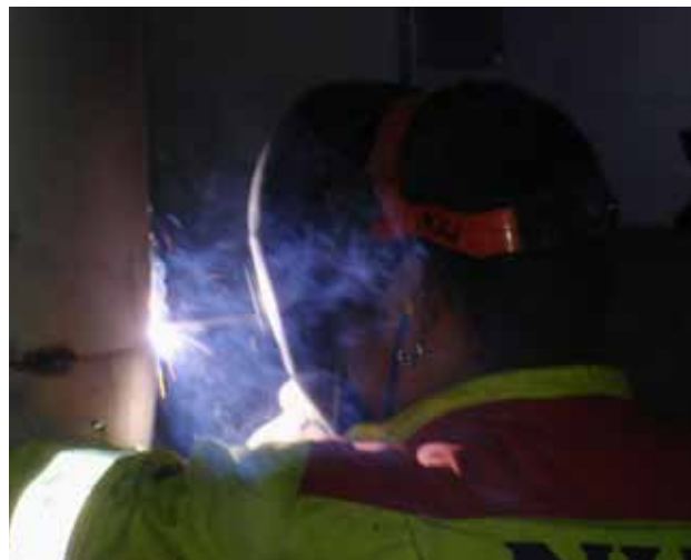
Pinnsvetsning. Det uppstår kraftig rökutveckling vid svetsning med belagda elektroder.