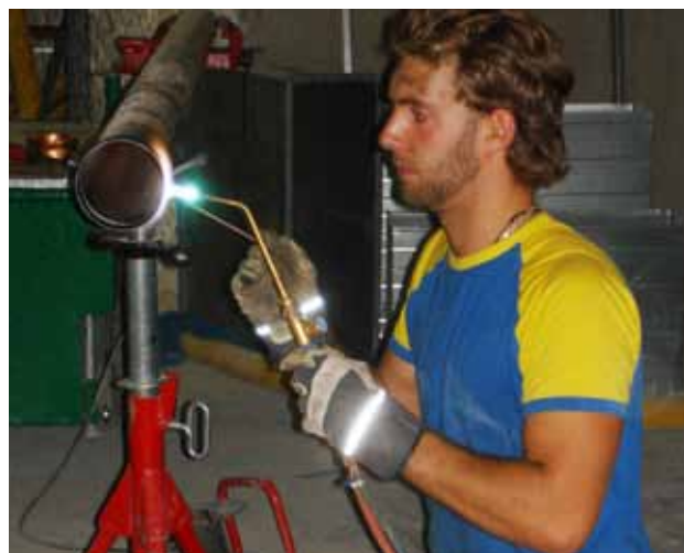
Vid lödning av kopparrör bildas kolmonoxid.